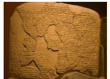
Σφηνοειδής γραφή των Χετταίων