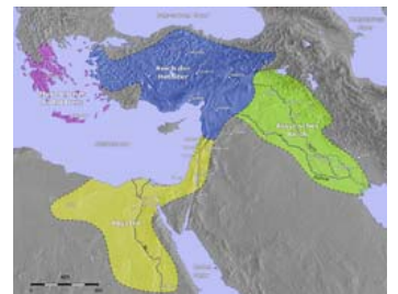
Η Ανατολική Μεσόγειος την περίοδο του απόγειου της Χεττιτικής Αυτοκρατορίας

Talowa = Τλος (η πλέον αρχαία πόλη της Λυκίας).