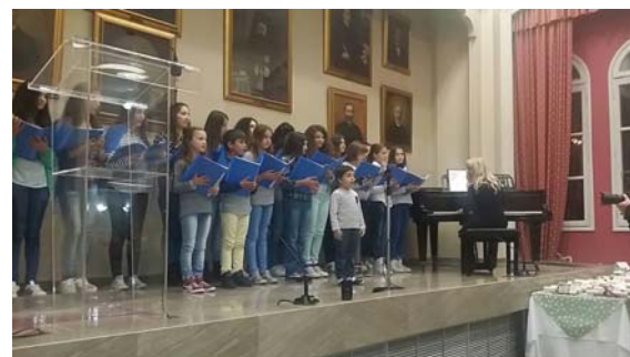
Η παιδική χορωδία της «Κιβωτού του Κόσμου»