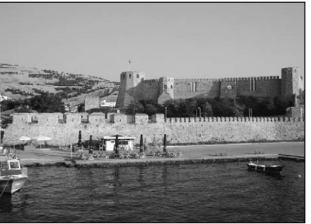
Τένεδος, το κάστρο

Επόμενος σταθμός μας μετά την Ιμβρο, ο Ελλήσποντος και η ξακουστή και μαρτυρική Τροία.