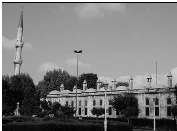
Η εξωτερική όψη του χαμάμ της Ρωξελάνης

ΚΩΝΣΤΑΝΤΙΝΟΥΠΟΛΗ. Για δεκαετίες, τα λουτρά του 16ου αιώνα που κατασκευάστηκαν για λογαριασμό της συζύγου του σουλτάνου Σουλειμάν του Μεγαλοπρεπούς, Ρωξελάνης, παρέμεναν ξεχασμένα και απαράτηρα ανάμεσα στο Μπλε Τζαμί και την Αγία Σοφία.