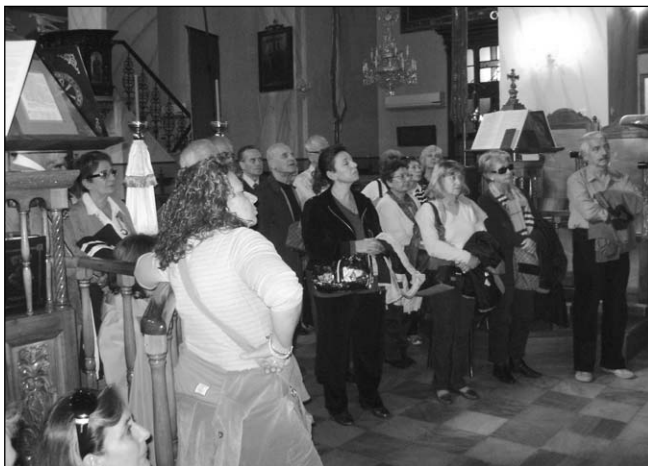
Μέσα στον Άγιο Νικόλαο την ώρα της ξενάγησης

Συνεχίσαμε για Αράχωβα, όπου μετά από μια βόλτα στα ωραία στενά της, καθήσαμε για καφέ και γλυκό και κατά τις 6.00, ικανοποιημένοι όλοι από την ενδιαφέρουσα ημέ-