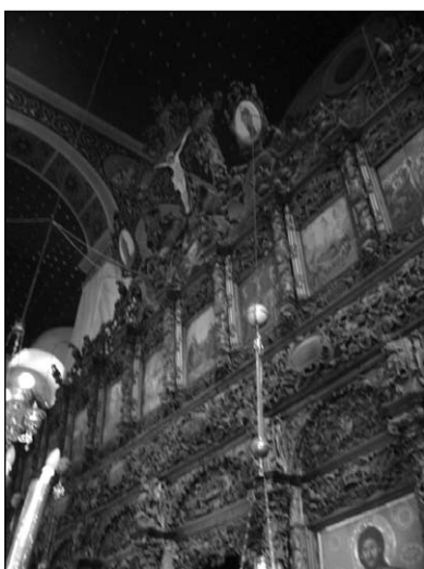
Το τέμπλο του Αγίου Νικολάου